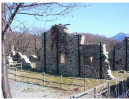
Santuario Martiri della Benedicta