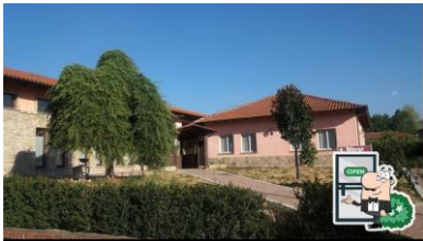
Ristorante Nuovo Secolo Torre Grande