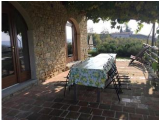
Cascina Barroero regno della nocciola