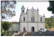
Santuario Ns. Signora delle Rocche (Molare)