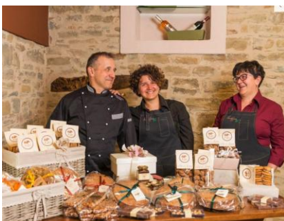
Pasticceria Gelateria Nocciolarte