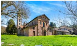
Badia di Tiglieto